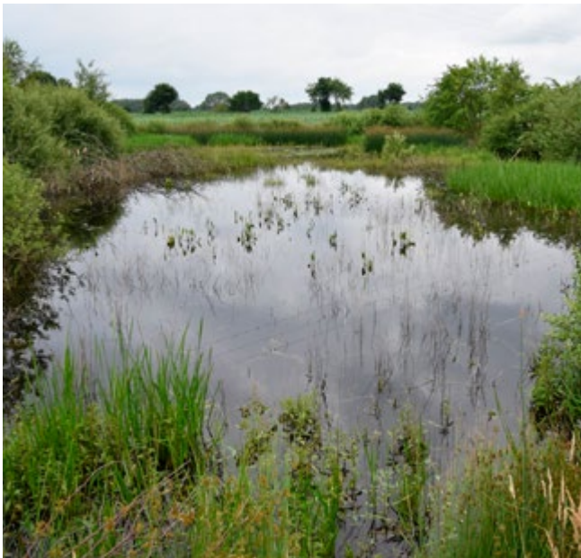
1 Laichgewässer „Vogelsang“ nahe Barnstorf. Foto F. Apffelstaedt, Juli 2020.