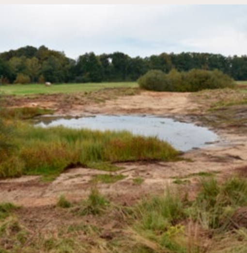
7 Abgeschlossene Lebensraum-Optimierung durch teilweises Verkahlen (Freilegen) von zugewachsenen Sandufnern. Hunteae Goldenstedt.

schaufeln am Hinterfuß) als auch ihre riesigen Kaulquappen. Hält sich tagsüber außerhalb der Fortpflanzungszeit vorwiegend im Boden / Sediment 10 – 60 cm tief vergraben auf.