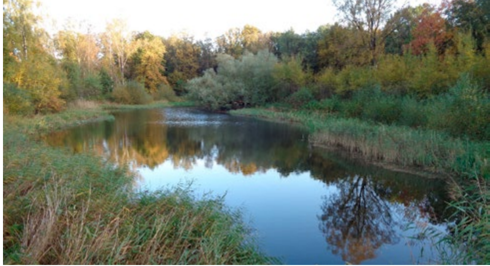
10 Amphibien-Laichgewässer Teich 17 der Ahlhorner Fischteiche. November 2021.

Feinde: Egel, Schnecken, Libellenlarven, Molche, Fische fressen Laich und Larven. Fressfeinde für alle Lebensformen: Ringelnatter, Frösche, Vögel (21 europ. Arten wie: Graureiher, Weißstorch, Schwarzmilan, Lachmöwe, Mäusebussard, Schleiereule, Waldkauz). Auch Spitzmäuse, Iltis, Wildschwein und wahrscheinlich Waschbär sind zu nennen. Adulte Tiere graben sich bei Gefahr schnell rückwärts in den Boden ein oder wehren sich, die Larven flüchten auf den Boden der Gewässer. Angegriffen droht die adulte Kröte mit Quien, bläht den Körper auf, stellt sich