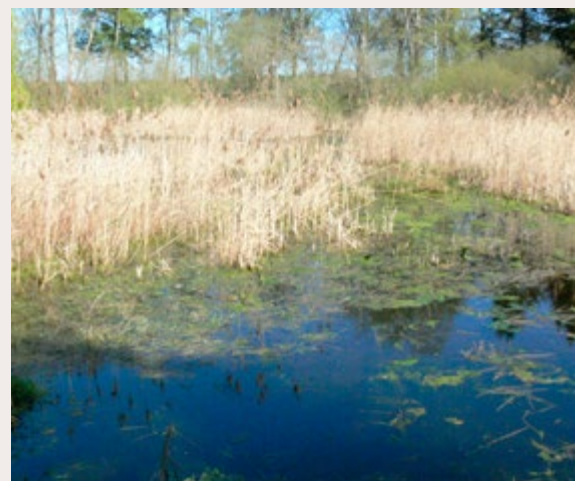
8 Knoblauchkröte Foto: T. Schikore 9 Laichkrautzone eines Teiches in Rüssen mit nachgewiesenem Knoblauchkrötenvorkommen. Fotos: Fr. Apffelstaedt, April 2020 (Info: Nachweis 2019 Larve, 2020 Rufer)

Individuen gezählt. Die Verweildauer im Laichgewässer liegt zwischen 12 und 17 Tagen. Häufiger wurden bei dieser Art überwinterte Larven im Laichgewässer beobachtet. Nach der Metamorphose sind die Jungkröten nur noch 2 – 5 cm lang und sind an Land vor allem auf Futtersuche.