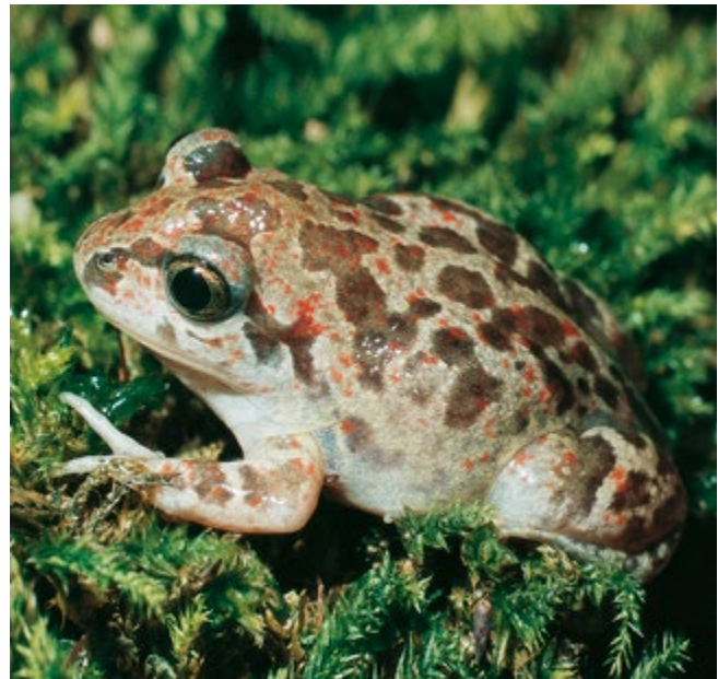
2 Knoblauchkröte – klein und bunt mit senkrechten Pupillen und Hinterfüßen als Grabschaufeln.

Wer nach Lurchen oder Amphibien gefragt wird, denkt wohl zuallererst an Laubfrösche, Grasfrösche und Erdkröten, vielleicht auch an Molche wie Teich- und Kammolche. Unter den Kröten kommen im Nordwesten auch die Kreuzkröten noch gelegentlich vor. Diese bevorzugen sandige Gebiete wie auf alten Dünen sowie Abbaugelände zur Sandgewinnung neben binsenbewachsenen Wassertümpeln, wo die doppelten Laichschnüre abgelegt werden.