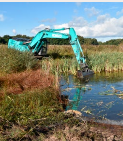
5 + 6 Freilegung eines potentiellen Laichgewässers, Rohrkolben und Schlamm werden teilweise entfernt. Hunteae Goldenstedt. Foto: F. Apffelstaedt, Oktober 2020