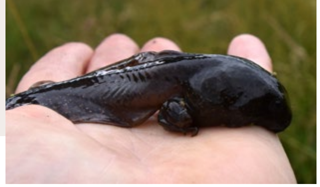
3 Riesenkaulquappe der Knoblauchkröte auf der Hand. Diese Amphibienlarven zeigen das Vorkommen der überwiegend nachtaktiven Alttiere an. Vogelsang nahe Barnstorf, Juli 2020.

- kurzgefasst - (Auszüge aus der Literatur)